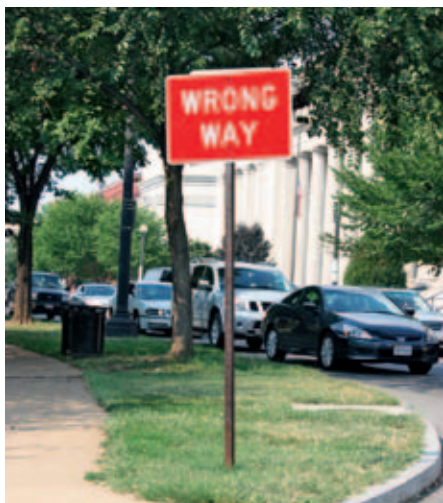
Künstliche Hormone sind der „falsche Weg“ und erhöhen das Brustkrebsrisiko.